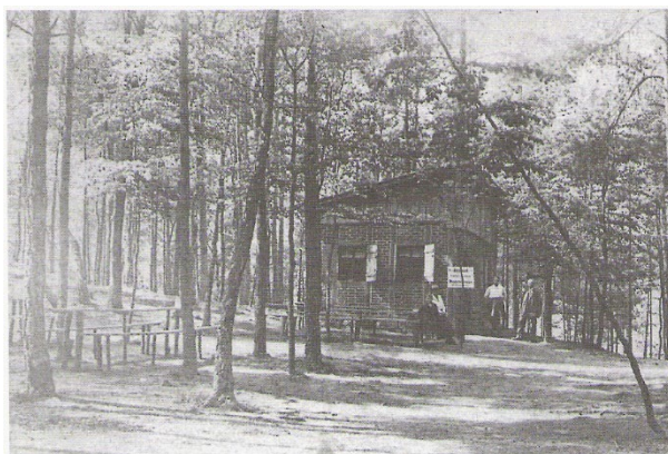
Das war der Anfang. Das Restaurant „Waldesruh“ des Konrad Hübner. Aufnahme von 1919/1920

Zum Schluss zur Erinnerung noch ein Blick in die Vergangenheit.