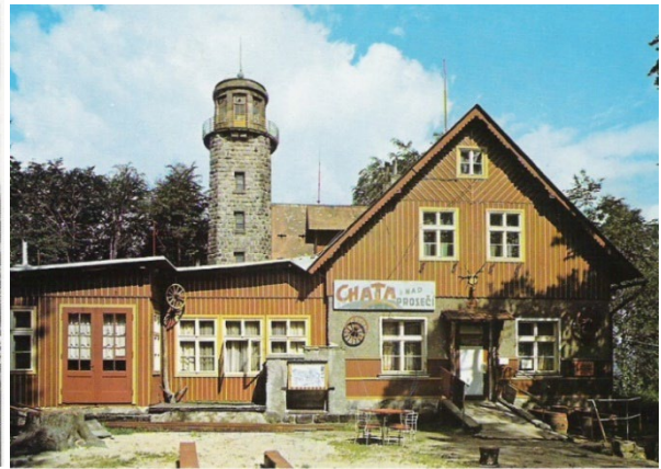
Ansichtskarte von 1990