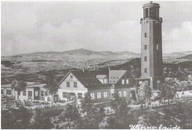
Ansichtskarte aus den 1930er Jahren