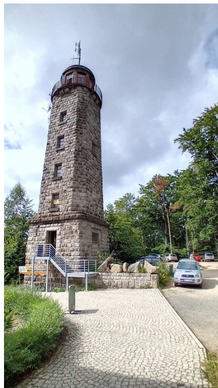
3. Turm Baubeginn 1925