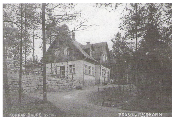
Die 1928 wiederum von Konrad Hübner erbaute Gaststätte, diesmal mit Raum für 500 Personen.