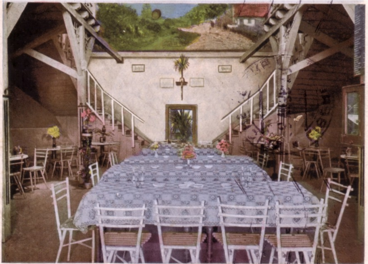
DAS RIESENFASS ist 14 m lang, 12 m hoch, 12 m breit und fasst 10238 hl - 400 Personen