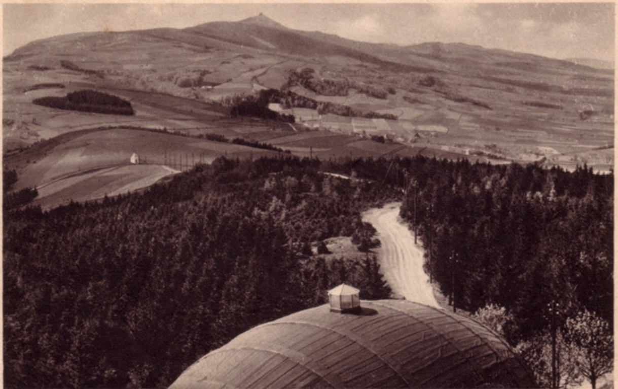
Obrovský sud, 14 m dlouhý, 12 m vysoký, 12 m široký