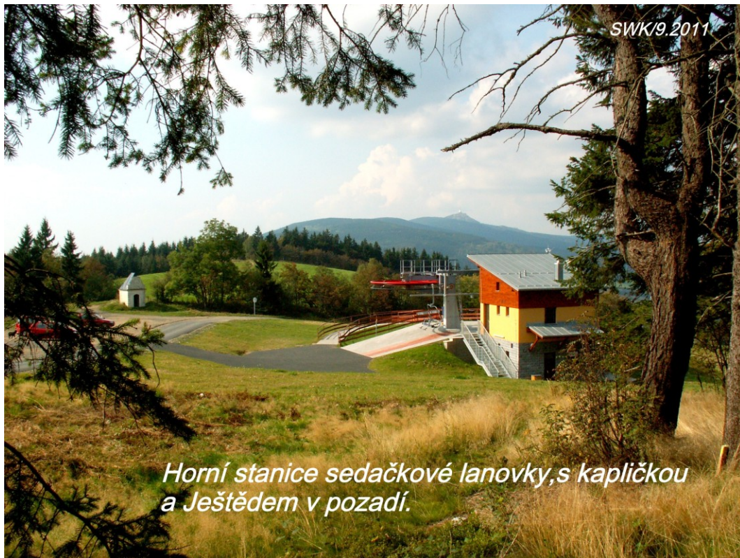
Horní stanice sedačkové lanovky, s kapličkou a Ještědem v pozadí.