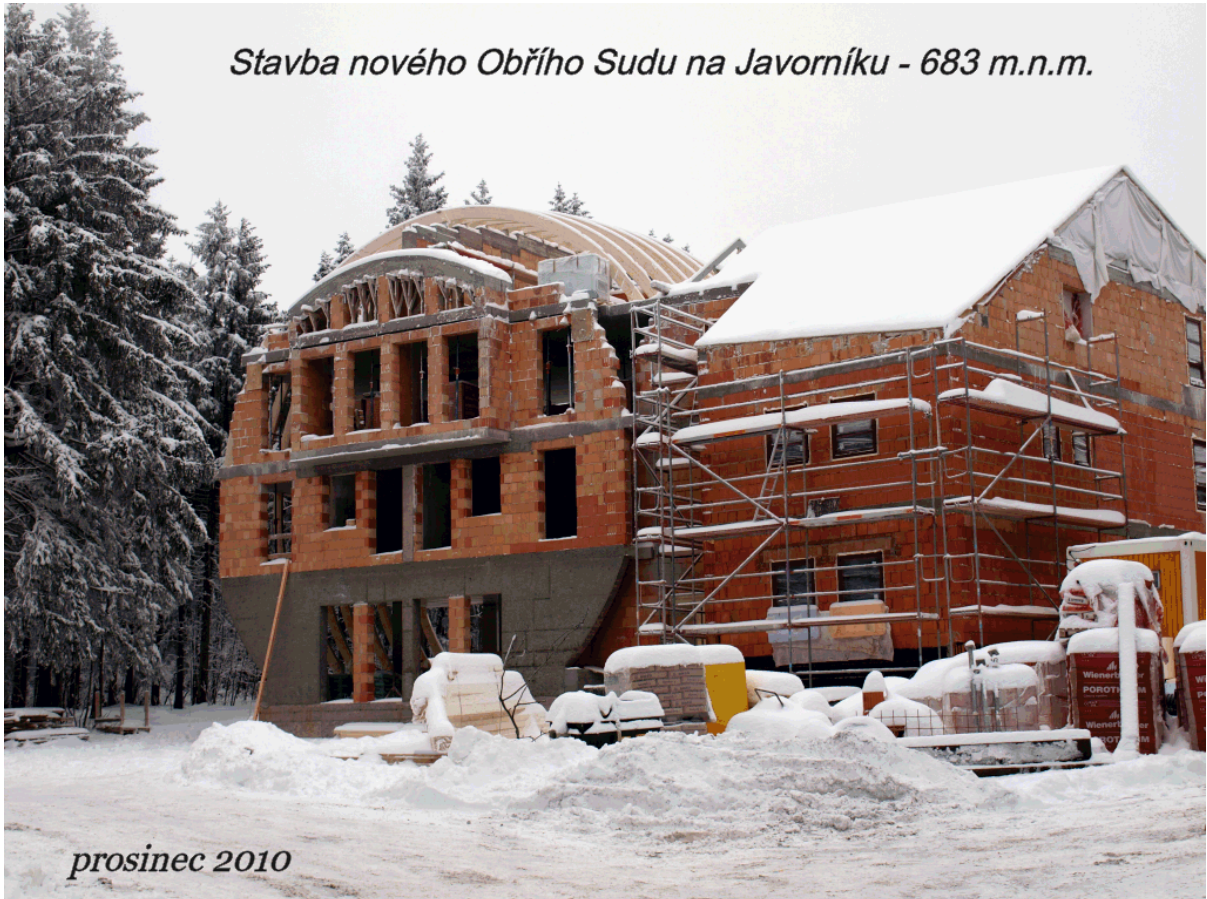
Stavba nového Obřího Sudu na Javorníku - 683 m.n.m.